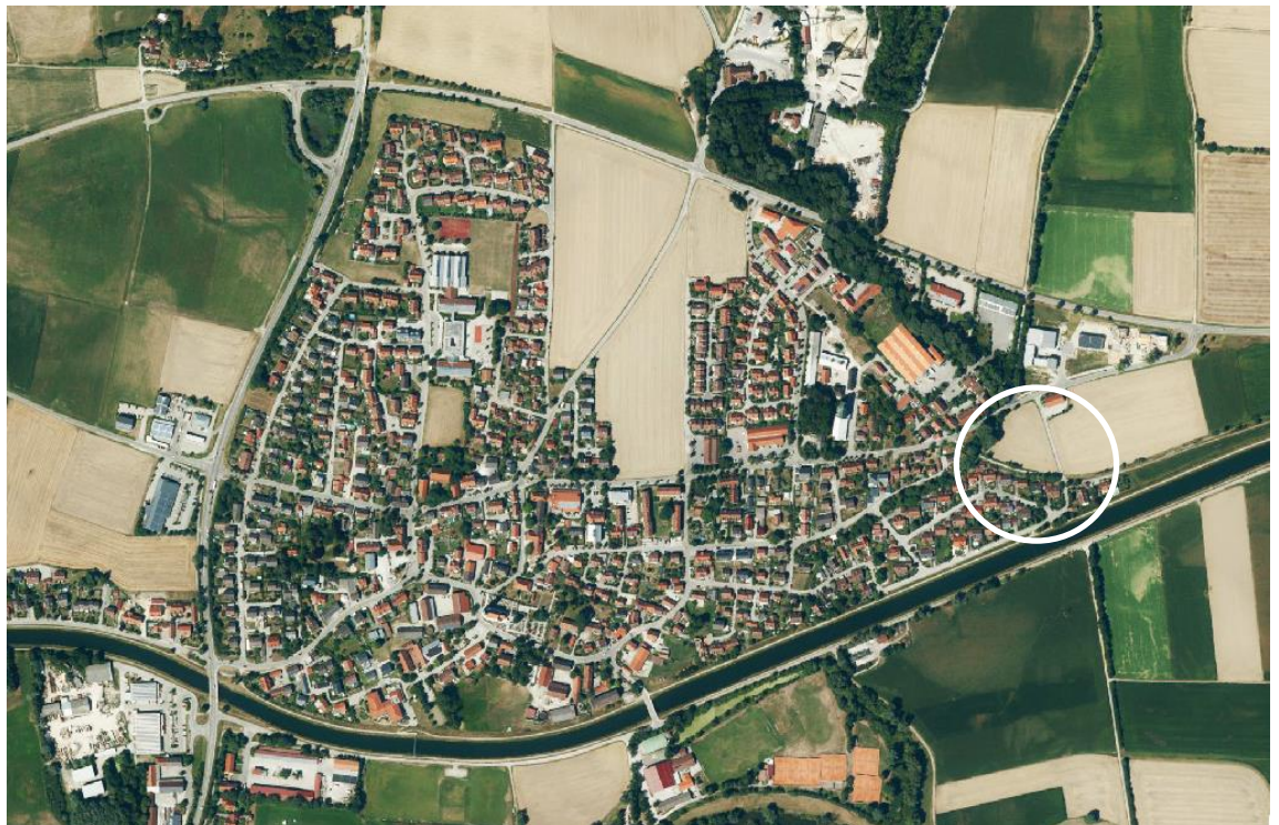
Abb. 1: Luftbild der Gemeinde Zolling (Kernort) mit Lage der zu detaillierenden Freifläche