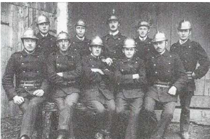
Mitglieder der Feuerwehr Inkofen um 1920

Aus der Zeit kurz nach der Jahrhundertwende sind viele Brände in Inkofen bekannt. Von 1903 bis 1911 brannte es in mindestens elf Anwesen. Besonders dramatisch war wohl der Brand 1904 im unteren Dorf, der beim Schmied ausbrach. Wie verschiedene Zeitungen berichten, konnten sich die fünf Kinder des Schmiedes nur durch einen Sprung aus dem ersten Stock auf die Straße retten. Das Feuer griff sehr schnell um sich und erfasste vier weitere Anwesen.